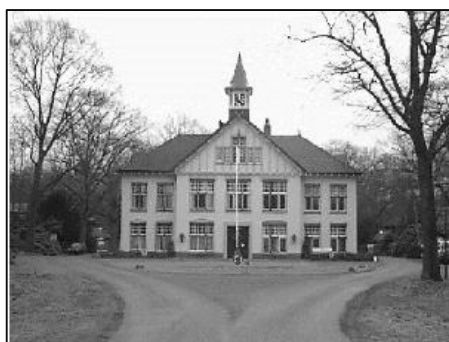
Voormalig Willem Arntsz hoofdgebouw

Op zaterdag 1 december 2001 organiseerde Euraudax een tocht van 25 km vanuit Den Dolder. Het was de