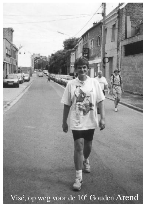
Visé, op weg voor de 10 e Gouden Arend